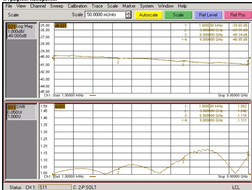
Графики для АЧХ - Log Mag, при отсчётном уровне равном -40 дБ, и для КСВ – SWR